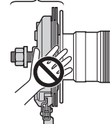
Секция с роллерным тормозом